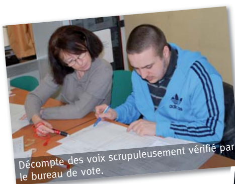
Décompte des voix scrupuleusement vérifié par le bureau de vote.

Cette nouvelle équipe, renouvelée au 3/4, a dû se mettre rapidement au travail et c'est au cours du premier Conseil d'administration que le bureau a été élu (voir organigramme).