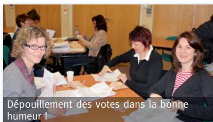
Dépouillement des votes dans la bonne humeur !

C'est le 14 mars dernier que s'est déroulé le dépouillement des votes par correspondances, visant à élire les membres du Conseil